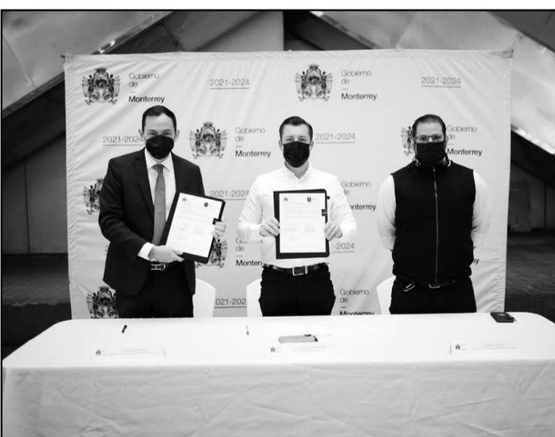
El objetivo es garantizar el acceso a la justicia de forma rápida