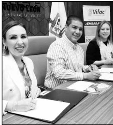
Se atenderán a las mujeres

“También tendrán capacitación para que continúen laborando, o si lo prefieren, instalar un negocio con lo que aprendan en cursos de autoempleo”, señaló el Alcalde. Dijo que el Municipio de Juárez