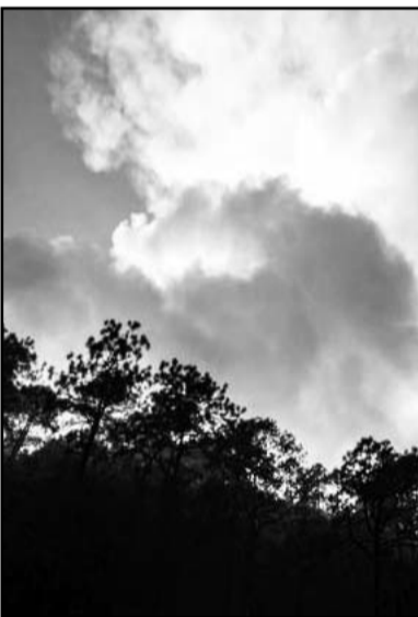
Todo sea para evitar incendios

“Pues ante la crisis del agua, si el incendio se repite no lo vamos a parar”, concluyó.(IGB)