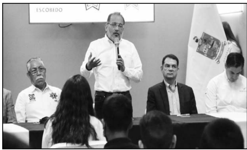
El alcalde, Andrés Mijes, encabezó el reconocimiento a los jóvenes